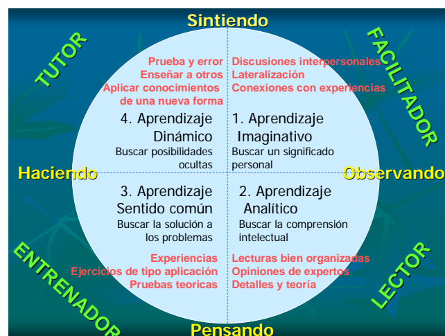
FIGURA 2. Sistema 4MAT.

Tanto los cuadrantes como los pares descriptores, mencionados en la cita anterior, son mostrados en la Figura 2.