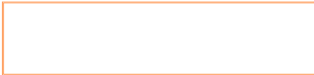
FIGURA 1b. Formato de secuencia didáctica solicitado por la SEP.

Contrasta con la visión hasta aquí expuesta, el que en el tercer reporte titulado “Comentarios de los docentes sobre los programas de estudio de 2º grado”, así como en el reporte titulado “Percepciones y valoraciones de los docentes y directivos sobre el Plan de Estudios 2006 con sus respectivos programas y el Modelo Renovado de Telesecundarias”; ambos pertenecientes al quinto informe nacional sobre seguimiento a las escuelas en el ciclo 2006 – 2007 11 elaborado por la SEP, se vislumbra un panorama de adaptación y convencimiento por parte de los docentes, destacando que sus preocupaciones oscilan más hacia el tema de la infraestructura y los recursos materiales. 35% de los docentes que han brindado información para la elaboración de este quinto informe señalan que para mejorar la aplicación de los programas de estudio, se requiere de capacitación en materia de planeación, diseño y diversificación de situaciones y actividades didácticas.