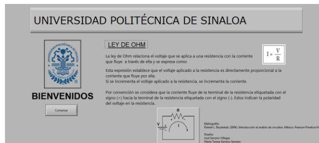
FIGURA 2. Presentación de la simulación de los circuitos serie paralelo.

laboratorio. Esta práctica fue llevada a cabo por los alumnos de los grupos G2-1 y G2-2 en el periodo Enero – Abril, de 2017. En ambas actividades, en 2016 y en 2017, los alumnos realizaron la prueba DIRECT V1.2 antes (pre test) y después (post test) de la actividad experimental.