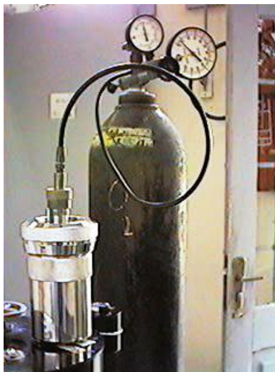
FIGURA 3. Cámara de reacción o bomba del calorímetro recibiendo el oxígeno a 20 atmósferas

ambigüedades cuanto más efectivo es un combustible que otro al usarlo para calentar una caldera, o para hacer girar la turbina de un avión.