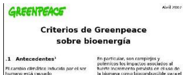
FIGURA 1. www.greenpeace.org/raw/content/espana/reports/criterios-de-greenpeace-sobre.pdf .

alegan que las nuevas tecnologías podrían hacer rentables una amplia variedad de posibles materias primas y desechos agrícolas, tales como los tallos del propio maíz y la paja de cereales.