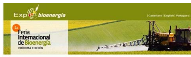
FIGURA 2. Logo de la Feria Anual Internacional “Expobioenergía’07”

Los residuos servirían no sólo para producir etanol, sino también plásticos y diversos productos químicos que