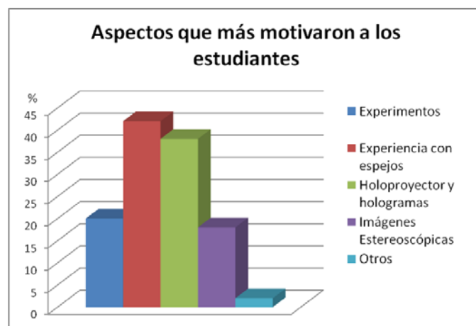
FIGURA 6. Resultado de la encuesta acerca de los aspectos que más motivaron a los estudiantes en la Exposición de Holografía.

A continuación mostraremos los principales resultados de las encuestas aplicadas