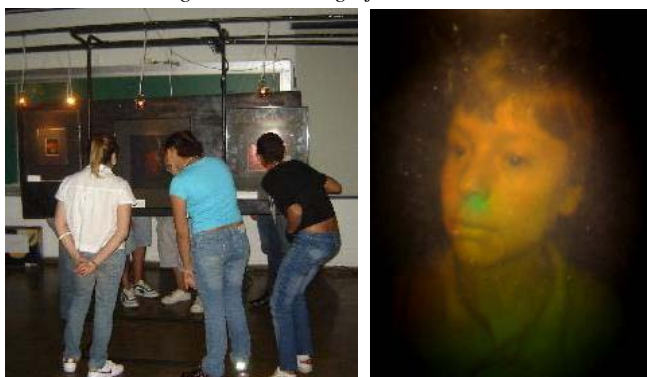
FIGURAS 4 y 5. Exposición de diferentes tipos de hologramas.