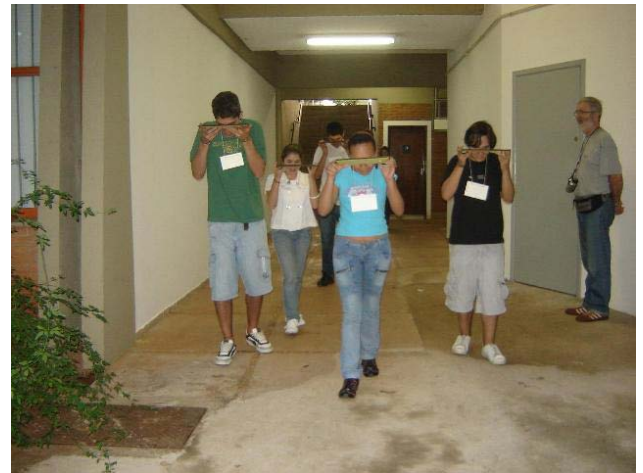
FIGURA 2. Alumnos experimentando con espejos.

Las figuras 2 y 3 muestran diferentes momentos de esta segunda parte de la actividad.