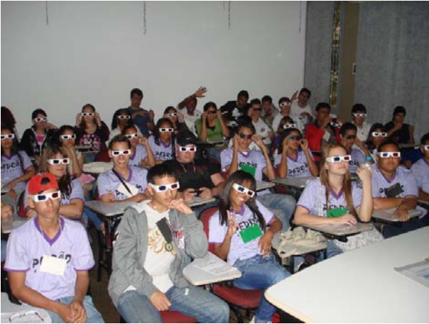
FIGURA 1. Alumnos con anteojos de dos colores observando las imágenes estereoscópicas.

La figura 1 muestra la parte de la conferencia inicial donde los alumnos observan imágenes estereoscópicas utilizando anteojos de dos colores repartidos por los monitores.