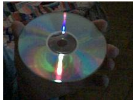
FIGURA 3. Difracción en un disco compacto.